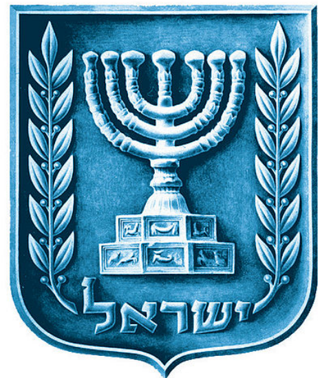
סמל מדינת ישראל

המוצא כלים ועליהם צורת חמה צורת לבנה צורת דרקון יוליכם לים המלח רבן שמעון בן גמליאל אומר שעל המכובדין אסורים שעל המבוזין מותרין רבי יוסי אומר שוחק וזורה לרוח או מטיל לים אמרו לו אף הוא נעשה זבל שנאמר (דברים י"ג) ולא ידבק בידך מאומה מן החרם.