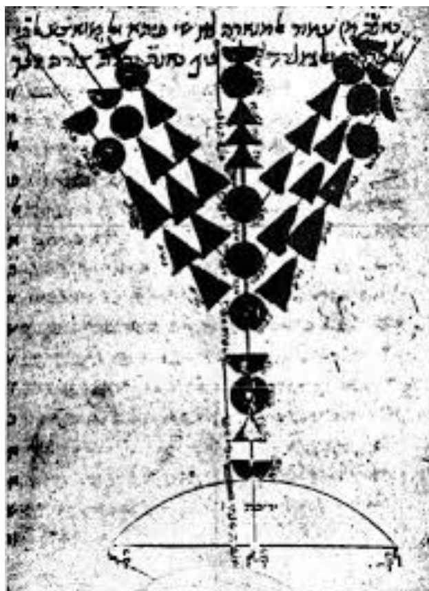
איור בכתב ידו של הרמב"ם פירוש המשנה למסכת מנחות

יצחק א. הלוי הרצוג אלא בתושבת או תיבה בלבד ועליה חקוקה צורת דקרון או דרקונים, וכזו היא נתגלפה בקשת טיטוס. (ז) יוצא מזה שלא טוב עושה ממשלתנו היום הזה, כשזכינו שוב לאורה של ציון המסומלת במנורה, שהיא מחקה דווקא את תמונת המנורה שבקשת טיטוס, אשר כנראה חלו בה ידי זרים, ושאינה כולה על טהרת הקודש כמו שמוכה מתורת רבינו משה גאון הגאונים ז"ל ומשאר מקורות היוצאים מחכמי התורה. ולא זו בלבד אלא שהעיד לפני אדם מומחה בידיעת הקדמוניות (ארכיאולוג) שהמנורות המצויירות על הקברים בקטומבות שברומי כולן בנות שלוש רג-לים (טריפורות) וכן כל המנורות המצויירות בפסיפסים של שרידי בתי הכנ-סת הנמצאים בארץ ישראל. ולדעתי כל זה ברור ושריר וקיים. בביקורו באיסליה להצלת ילדיישראל מיד המנדטים ברחבי אירופה, ביקר ראש הרבנים באחרים היסטוריים ופרטם לאחר מכו מאמרים והכתמים וסדעיים עליהם.